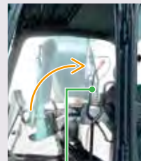
昇降遮断ロックレバー